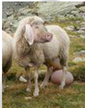
Vellus lactes Porca

Und niemand soll jemals behaupten, daß ich es nie versucht hätte!